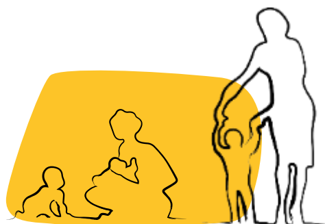
Malnutrition aiguë modérée et sévère