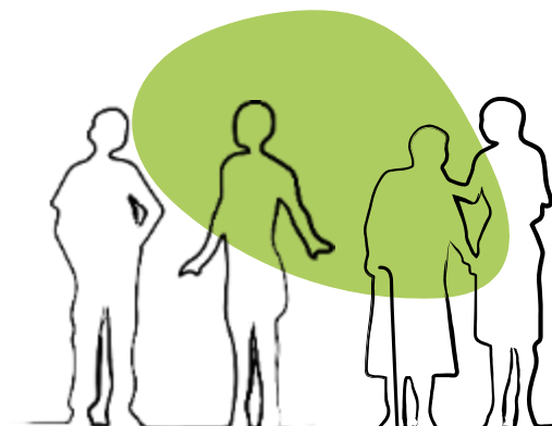
Nutrition aux étapes clé de la vie